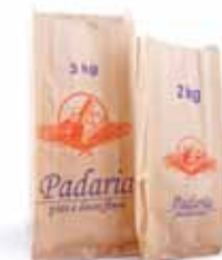
Sacos Kraft Pardo 100% celulose impresso pães e doces