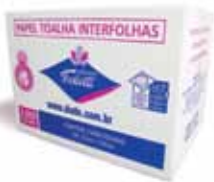
Interfolha Toaletti - Premium

Economia com máxima maciez. Alta gramatura. Essa é a toalha folha simples mais absorvente produzida no Brasil. Folha simples branca