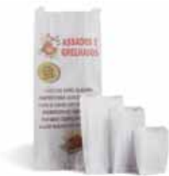
Sacos de Papel Marca Dadu

Produto 100% celulose. Grande resistência e qualidade, ideal para armazenagem de alimentos. Fabricamos vários modelos, sempre de acordo com o rigoroso padrão de qualidade Dadu. Avalie de acordo com a sua necessidade.