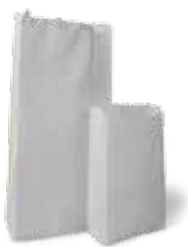
Sacos Kraft Lutepel 100% celulose Branco Liso