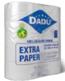
Higiênico Institucional Rolos e Intercalados