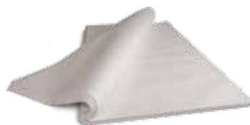
Toalhas de mesa Monolúcido

Produto 100% celulose. Toalhas para cobertura de mesa. Garantia de higiene, praticidade e excelente absorção no dia-a-dia. Fabricadas de acordo com o rigoroso padrão de qualidade Dadu. Avalie de acordo com a sua necessidade.