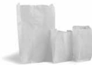
Sacos de Papel Marca Premiatta