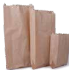
Sacos Kraft Pardo Lutepel 100% celulose Marca Dadu