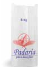
Sacos Kraft Branco Lutepel 100% celulose impresso pães e doces