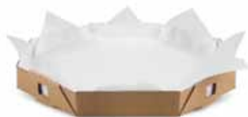
Forro de pizza Glasspel

Papel canelinha e seda usados para panificação e demais embalagens.