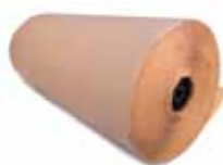
60 gr/m 2